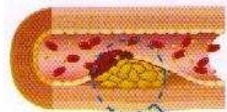
コレステロールなどがたまって狭くなった血管

A: 血管が硬くなると弾力性が失われ、血管の内側にコレステロールなどがたまり、内径が狭くなって血液の流れが悪くなります。このような状態を「 動脈硬化 」と呼び、命にかかわる病気の危険性が高まります。